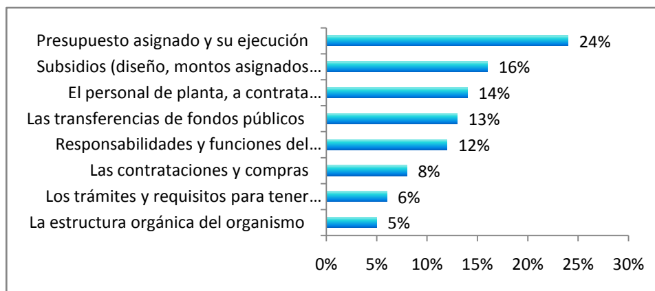
Gráfico 1: Ítems medidos directamente en la encuesta (N=1015)

La construcción del ponderador se fundamentó en las siguientes etapas: El análisis de la experiencia internacional , es decir, la identificación de los criterios que otros organismos fiscalizadores han usado para determinar la ponderación de los ítems de la fiscalización, donde destaca la experiencia del modelo mexicano, que cuenta con una legislación similar a la chilena en materia de transparencia activa. Adicionalmente, se consideraron los resultados del Estudio de posicionamiento del Consejo y la Ley realizado en los meses de Enero – Marzo 2010, a través de los cuales se recogen las expectativas e intereses ciudadanos en términos de acceso a la información pública. La estimación de los valores finales se definió de la siguiente manera: Primero, se revisaron los valores de la encuesta de posicionamiento para cada una de las dimensiones definidas en las cuales se capturaron datos relevantes para su evaluación. Como la encuesta no sometió a la evaluación ciudadana todos los ítems de transparencia identificados en la Ley y el instructivo, fue necesario realizar un ajuste proporcional usando variables que sirvieran como “proxy” de estimación de las dimensiones que no fueron testeadas de manera directa en la encuesta.